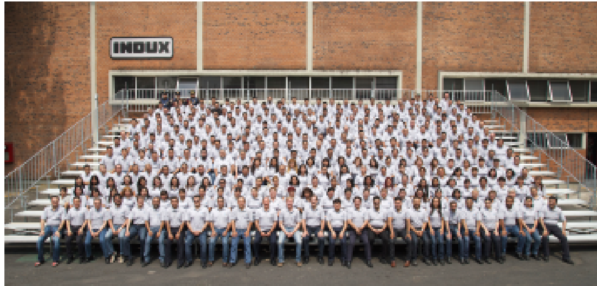
60 Aniversario Indux, Ciudad de México.