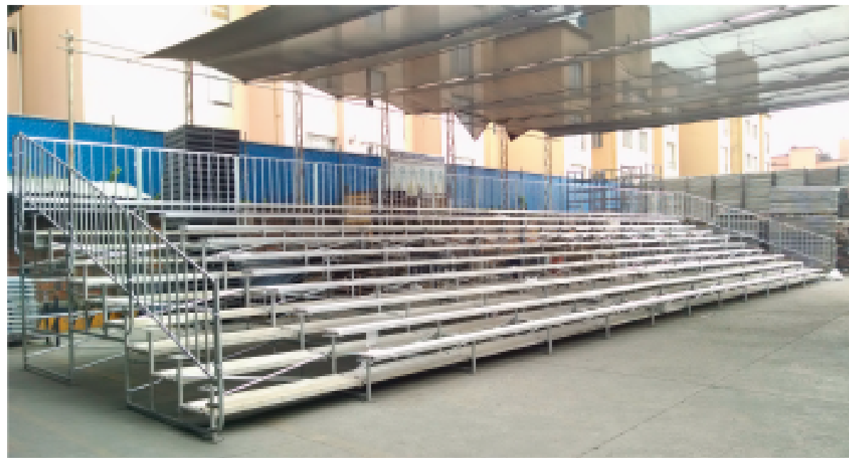
Gradas Cimbramex, Huixquilucan, Ciudad de México.

Acércate con el equipo comercial de tu localidad y con gusto te atenderemos • México • Coahuila • Guadalajara • Monterrey